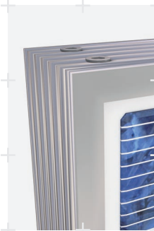
El marco AXITEC „soft grip“/ Original AXITEC soft-grip frame

AC-194P/156-60S AC-200P/156-60S AC-206P/156-60S AC-212P/156-60S AC-218P/156-60S AC-224P/156-60S