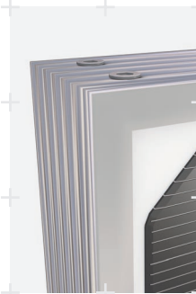
Original AXITEC Soft-Grip-Falz/ Original AXITEC soft-grip frame

AC-180M/125-72S AC-183M/125-72S AC-187M/125-72S AC-190M/125-72S