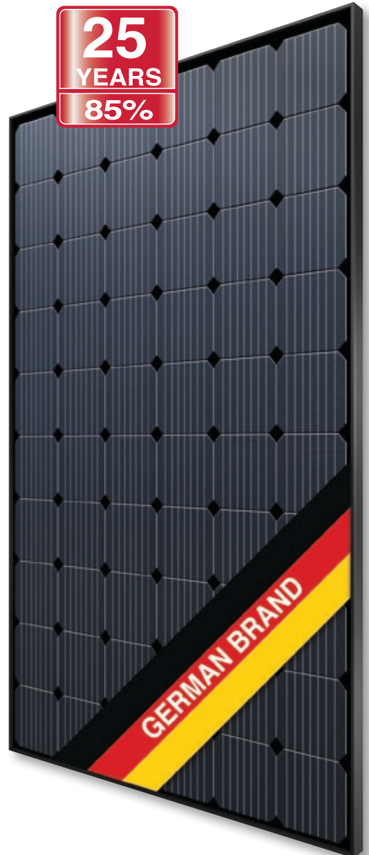
Abb. ähnlich 60M156DE170724A