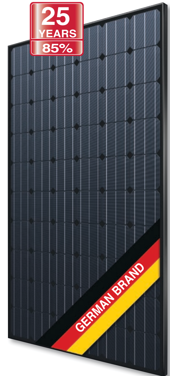
Abb. ähnlich 60M156DE161116A