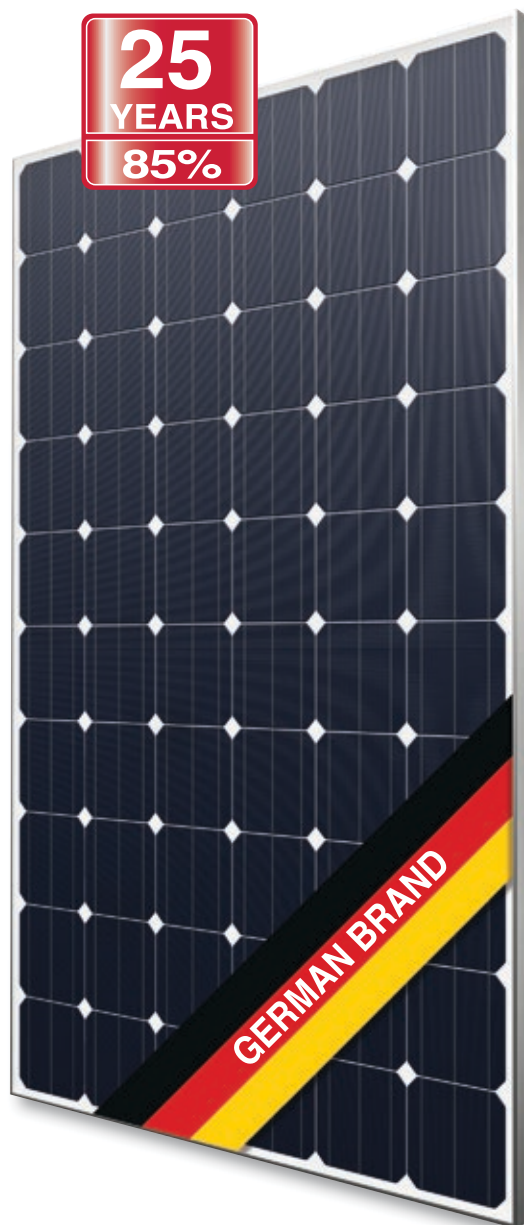
Abb. ähnlich 60M156DE171019A