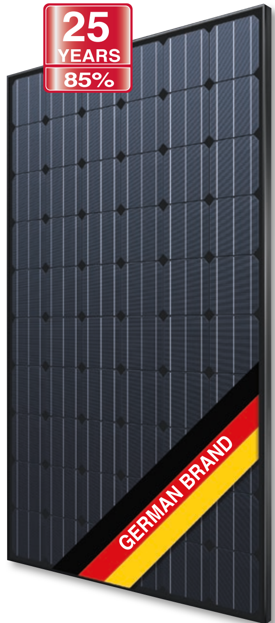
Abb. ähnlich 60M156DE180326A

Exklusive lineare AXITEC Höchstleistungs-Garantie!