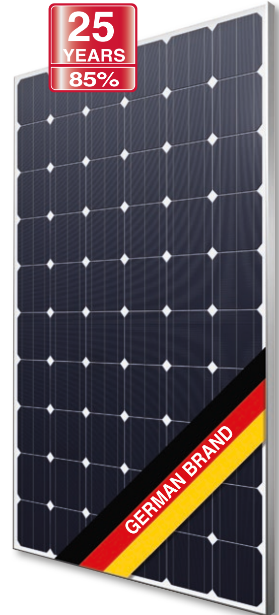
Abb. ähnlich 60M156DE180322A