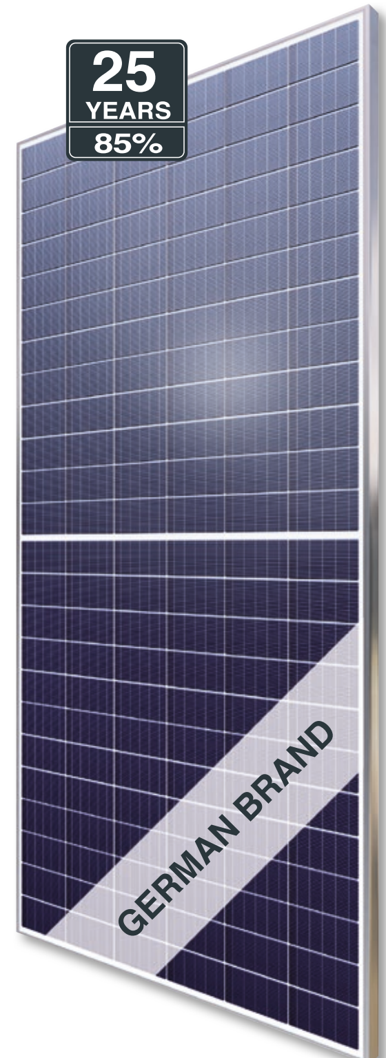
Abb. ähnlich 144MHDE201026A