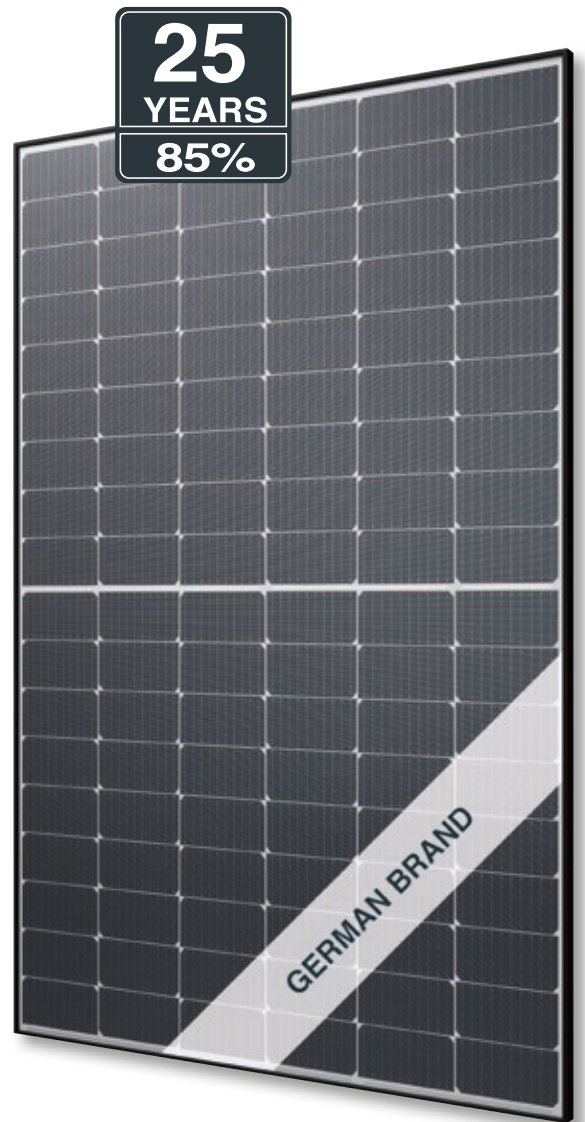
Abb. ähnlich 108MHDE221024A