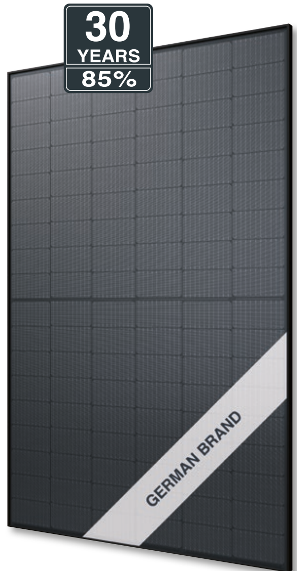
Abb. ähnlich 108MGDE220829A