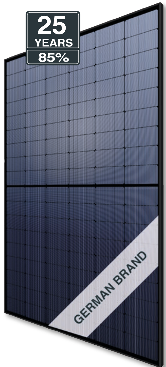
Abb. ähnlich 108MHDE210316A

Exklusive lineare AXITEC Höchstleistungs-Garantie!